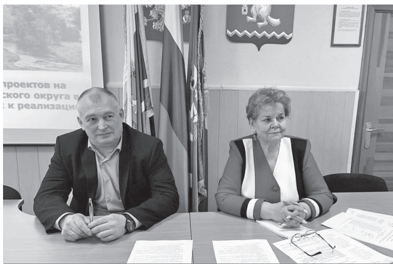
На фото: заседание Общественной палаты АГО

Новый собственник Артёмовского АТП рассказал о планах и изменениях в работе предприятия.