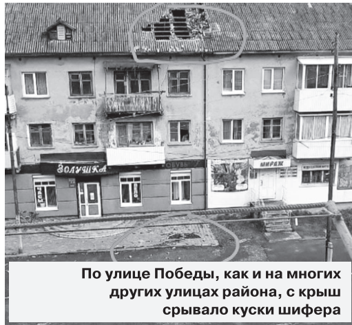
По улице Победы, как и на многих других улицах района, с крыш срывало куски шифера

но иногда и кирпичи. Шквалистый ветер во многих районах города оборвал провода электроэнергии, многие жители остались без света. От разгулявшейся стихии хорошо было мусорным контейнерам на станции, которые, так