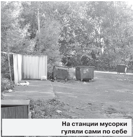
На станции мусорки гуляли сами по себе

Ураганный ветер вырвал деревья с корнями, дорожные знаки, срывал баннеры и вывески. С крыш домов сдувало не только шифер,