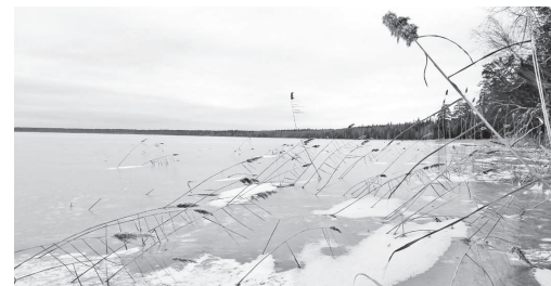
Дыхание зимы: постепенно надвигаются холода / Фото: А. Рожков

- В эти дни многие рыбаки идут на водоемы, хотя лед еще недо-