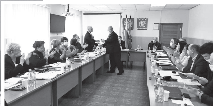
На заседание Думы пришли 20 депутатов. Почти по всем вопросам голосовали единогласно

Вчера депутаты Думы 7 созыва собрались на второе заседание, оно было перенесено с прошлого месяца.