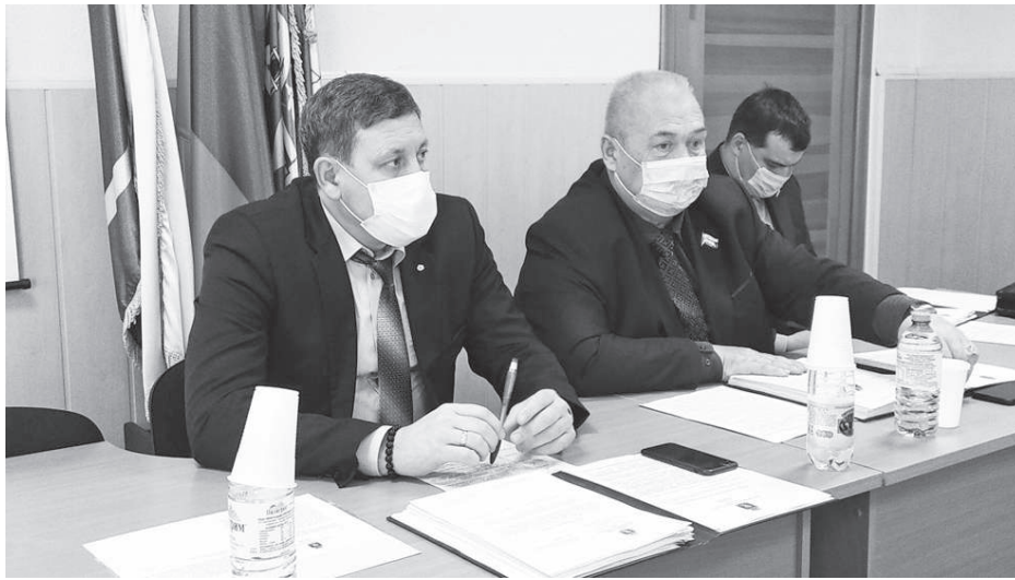
В конце года у работников администрации АГО и депутатов Думы очень много работы

Рассматривали вопросы без него, в спокойной обстановке. Сначала назначили публичные слушания по проекту бюджета АГО на 2022 год и плановый период 2023 и 2024 годов. Следом рассмотрели вопрос, который вызывал споры: о земельном налоге на нашей территории, который повышается. Как пояснялось, повышение необходимо не только для наполнения бюджета, но и для вовлечения в оборот тех земель, которые зарастают и не используются. Решили повысить налог на коэффициент 1,2, хотя в соседних районах