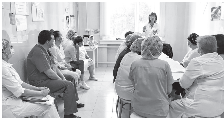
Проходить серьезную переаттестацию родильному отделению нужно раз в три года

Проходить серьезную переаттестацию родильному отделению нужно раз в три года