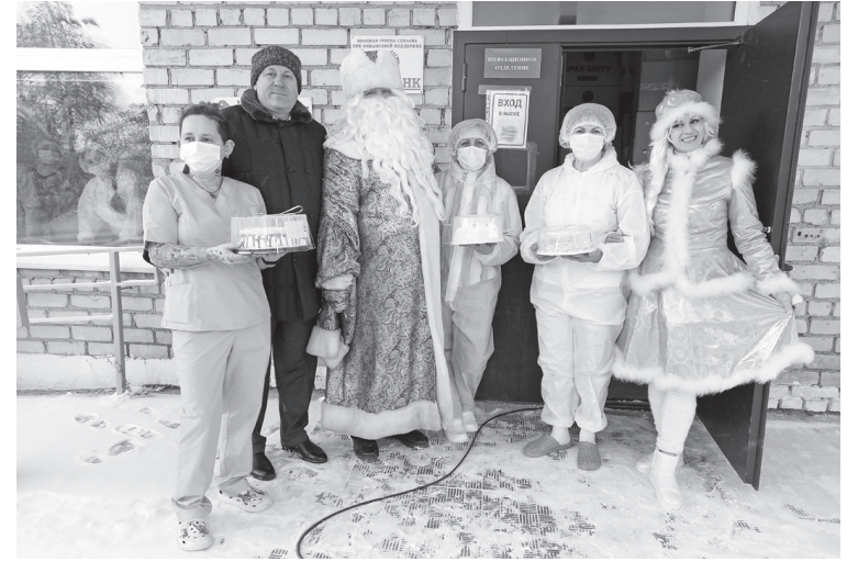
Медикам подарили немного радости и праздничного настроения

и заводные скоморохи из ДК им. Попова наполнили атмосферу радостным предвкушением Нового года. В пляс пустились и медики, и гости, что пришли их поздравить.