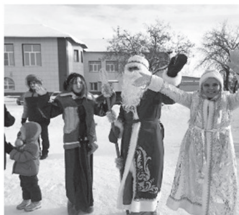
Раз в год, зимой, в п. Буланаш случается нашествие Дедов Морозов. И это верная примета - праздник к нам спешит!

В п. Буланаш в воскресенье, 26 декабря, открыли снежный городок. Как водится, весело и задорно, с песнями, хорородами, стихами, поздравлениями и целым штатом местных Дедов Морозов и Снегурочек.