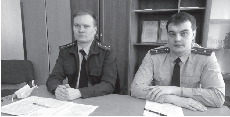
Сотрудники прокуратуры рассказали СМИ о своей работе по контролю за качеством дорог

- Также в суде рассмотрены исковые заявления по обустройству тротуаров в селе Писанец, поселке Красногвардейском и по улице Радищева в поселке Буланаш, - говорит