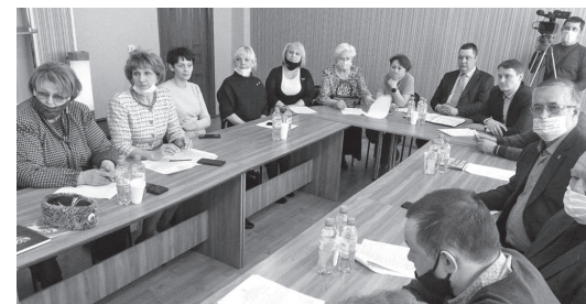
Участники встречи активно обсуждали поднятую тему.

- Есть потребность в квалифицированных кадрах, но людям нужна зарплата, а она