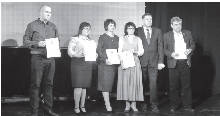
Праздник День МСУ отмечается в России с 2012 года

В среду, 21 апреля, сотрудники российских муниципалитетов отмечали свой профессиональный праздник - День местного самоуправления.