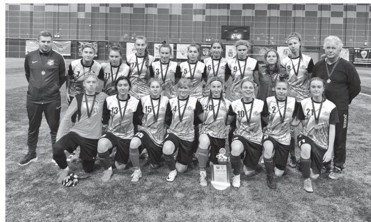
☑ Фото предоставлено автором

Первый матч с «хозяйками» соревнований, командой Пермского края, складывался не просто, при счете 2:0, еще в первом тайме у нас произошло удаление. Вратарь, спасая ворота, сыграла руками за пределами своей штрафной площади. И, несмотря на то, что ко-