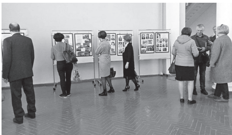
☑ В зале была организована выставка

17 апреля в Доме культуры «Угольников» состоялась презентация книги «Школа, которой нет», посвященная истории школы №28.