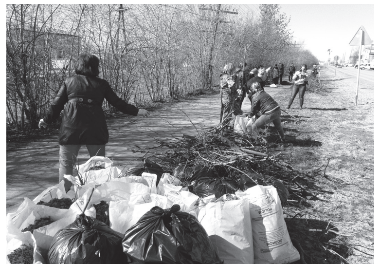
Работники артемовской администрации навести порядок на центральной улице города