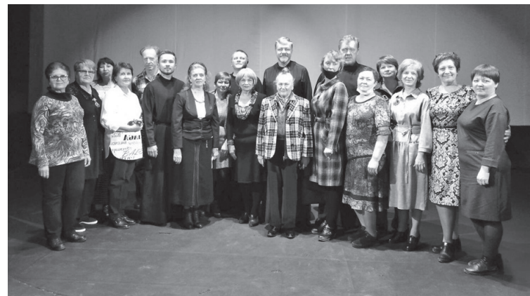
☑ Участники поездки сфотографировались с ансамблем

Конечно, по традиции, мы сделали общее фото с участниками ансамбля!