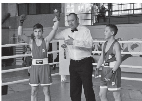
Турнир по боксу на Кубок главы АГО набирает обороты