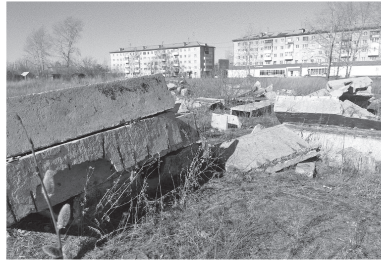
Уже много лет жители города живут рядом с железобетонной помойкой

Сначала «Облкоммунэнерго», а затем дочка компании – ОАО «ОТСК» вложили миллионы рублей в артемовскую теплотрассу. Город избавился от проблем с теплом, но в наследство после глобальных ремонтов его жителям досталась огромная свалка. Кажется, мы уже привыкли к ней и вообще смирились, что наш город «украшают»