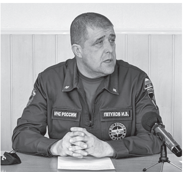
Пожары угрожают району

Вводится на территории АГО с 23 апреля. Запрещено разводить костры и сжигать мусор.