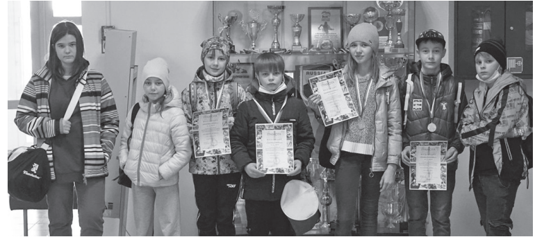
📷 Наши пловцы показали отличные результаты

17 апреля в ФСЦ «Орион» в Верхней Синячихе состоялось первенство ДЮСШ МО Алапаевское по плаванию. Артемовцы завоевали 13 медалей.