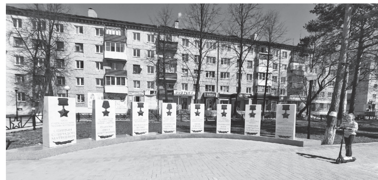
Украсить стелы бронзовыми орденами - идея руководства «Жилкомстрой»

К 9 Мая артемовский сквер Победы значительно преобразился.