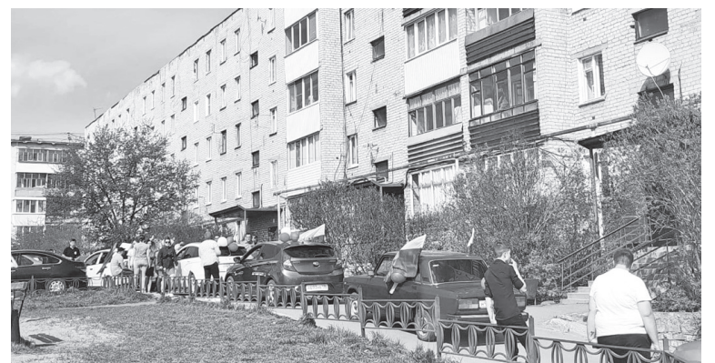
Не все участники автоколонны поместились во дворе дома №13 по улице Энгельса