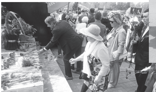
Артемовцы помнят и чтят эту память

9 мая артемовцы отпраздновали День Победы. По мнению многих, этот праздник был одним из лучших в плане организации и проведения.