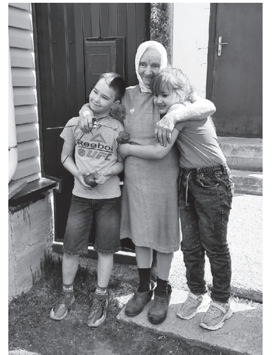
Герои праздника тепло встречали участников автопробега

Вместе с виновниками торжества участники автомотопробега пели песни военных лет. В честь героев звучало троекратное «Ура!».