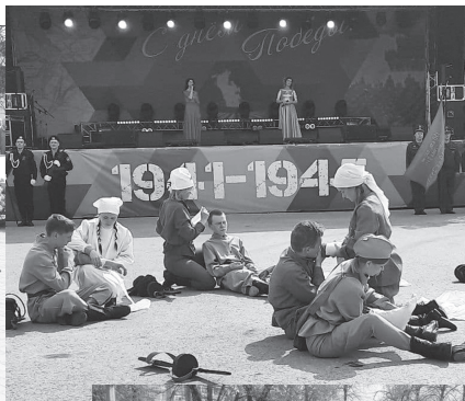
Театрализованная постановка - как экскурс в прошлое. Помогла окунуться в атмосферу военного времени