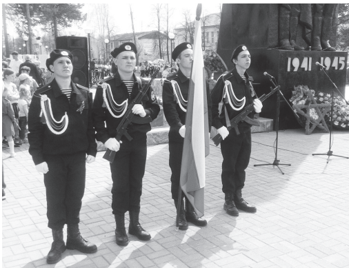
9 Мая было море цветов в честь героев Великой Отечественной войны, минута молчания и оружейные залпы в небо