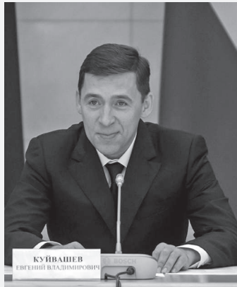
Губернатор Свердловской области Е.В. КУЙВАШЕВ

С Новым годом и новым счастьем, дорогие земляки!