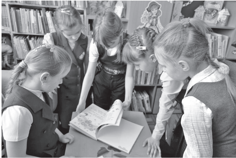
На фото: Поиск «сокровищ книжных морей» на библиокешинге

Придя в один из дней каникул в Мироновскую библиотеку, юные читатели попали на «День веселых затей». Одни задания сменяли другие: то ты сыщик и должен узнать книжного героя по «ориентировке», то