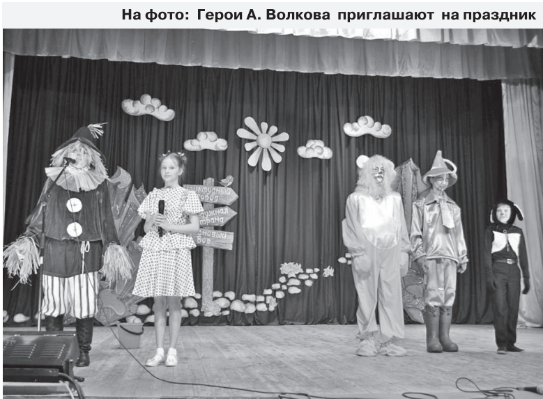
На фото: Герои А. Волкова приглашают на праздник