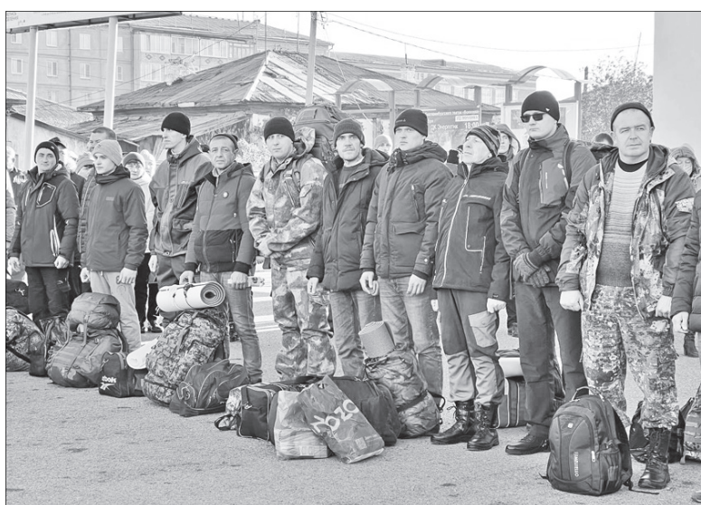
Вот как это было

чит «русский дух», и проявить его. Наши герои будут это делать на передовой, а мы – здесь, в тылу. Мы будем помогать им отсюда и молиться, молиться, молиться!