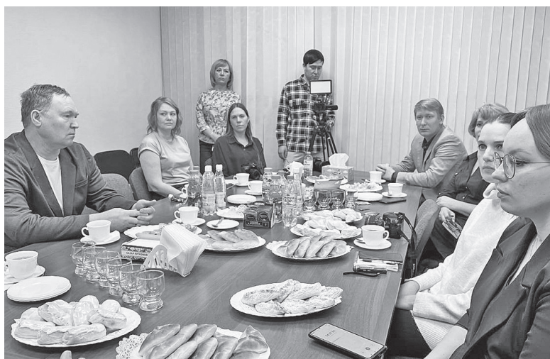
Пресс-завтрак для СМИ в формате онлайн впервые охватил всю область. Журналисты Артёмовского и других малых городов смогли задать свои вопросы