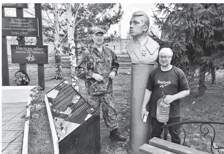
Памятники вернули с реставрации в конце апреля