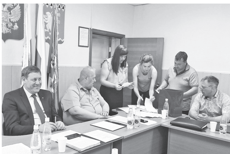
К Дню города ряды Почетных граждан пополнятся - депутаты избрали двух человек

Еще одним важным решением стало избрание Почетных граждан.