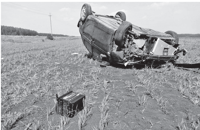
Такая авария могла стать трагической

В прошлое воскресенье, 4 июня, на трассе Артёмовский - Арамашево произошло серьезное ДТП. К месту ЧП выезжали спасатели.