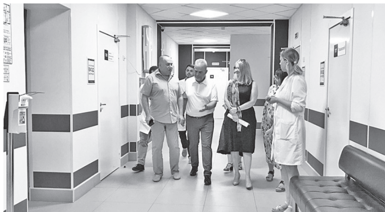
Отремонтированное здание поликлиники очень понравилось министру

Вечером, 2 июня, в Артёмовской ЦРБ побывал министр здравоохранения Свердловской области Андрей Карлов