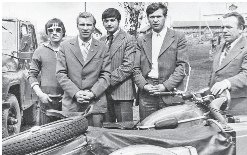
Работа на местах, общение с людьми всегда приносили результат

С декабря 1990 года перешел работать председателем совета учредителей акционерной компании «УРАЛСЭСТ». В 1991 году был назначен генеральным ди-