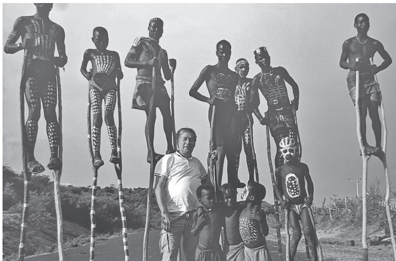
Наш земляк в Африке