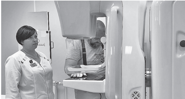
Скоро маммограф запустят в работу

Специалисты оценили более высокие скорость и качество работы цифрового аппарата по сравнению с имеющимся в больнице аналоговым. «Картинка» получается более чёткая, лучевая нагрузка низкая. Кроме того, аппарат более эргономичный и приятный по дизайну.