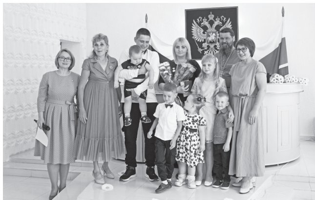
В ЗАГСе вручали награды «Материнская доблесть» и «Совет да любовь»