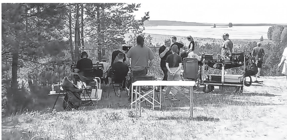
Кино посвящается детям и их доброте

В качестве места для съемок были выбраны живописнейшие окрестности