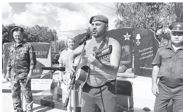
Без песни про боевое братство, про верных и смелых друзей в этот день никак нельзя

В адрес артемовских «голубых беретов» прозвучало еще много теплых слов от