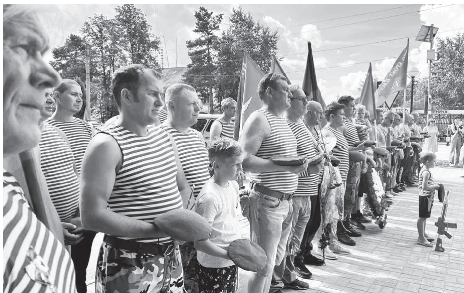
Важная часть любого Дня ВДВ: вспомнить тех товарищей, которых нет рядом

2 августа в Артемовском, как и по всей стране, отметили День ВДВ