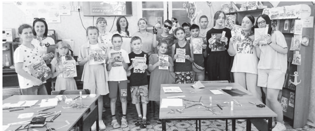
Полсотни книг из АГО отправятся в новые регионы

Артемовская центральная детская библиотека совместно с РДДМ «Движение первых» приняла участие во Всероссийской акции «Книга другу».