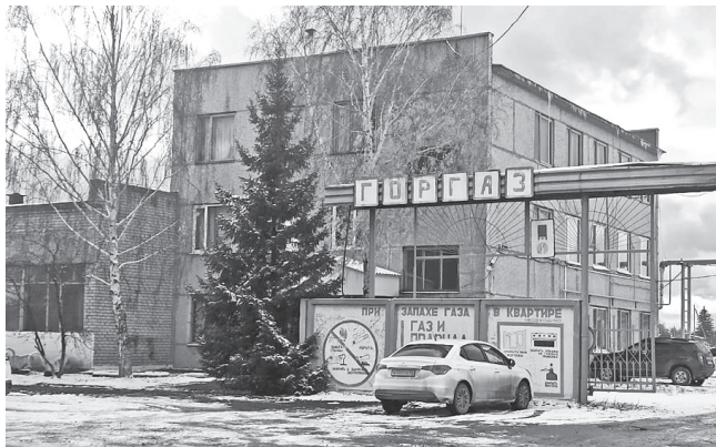
В ГУП СО "Газовые сети" ждут потребителей газа

вопросам обеспечения безопасности при использовании и содержании внутридомового и внутриквартирного газового оборудования», утвержденным постановлением Правительства Российской Федерации от 9 сентября 2017 г. № 1091»: