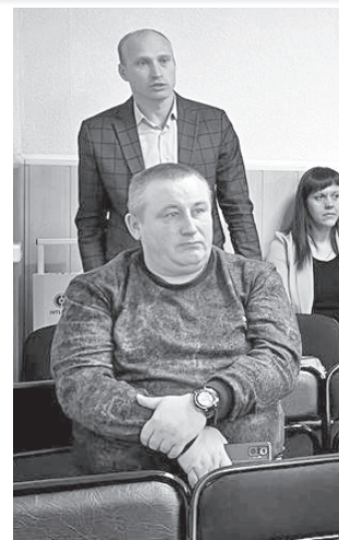
Житель АГО в ходе заседания.