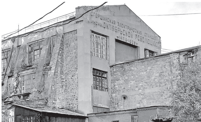
Егоршинская электрическая станция имени Октябрьской революции / Фото: предоставлено музеем ЕГРЭС

ПО ДАННЫМ на 9 января 1926 г., в Егоршино было освещено 265 домов, установлено 350 лампочек и поставлено 5 уличных фонарей. Как рассказывали старожилы, в то время в Егоршино приезжали крестьяне из других деревень и сел, чтобы увидеть своими глазами чудо - электрическое освещение.