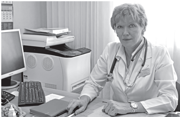
Каждую минуту в стране происходит 7 переломов позвонков, каждые 5 минут – перелом шейки бедра