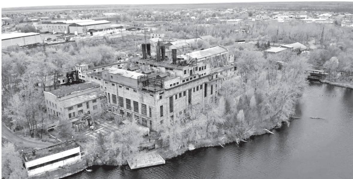
Егоршинская электростанция - уникальный объект и сокровище индустриального наследия Среднего Урала

- С того момента электростанция продолжает выполнять функции источника и распределения тепловой энергии. То есть производственная котельная ТЭЦ вырабатывает тепло, по теплоносителю отправляет его на ЕГРЭС.