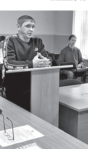
Жителям нужно актуальное расписание на остановках /

Много нареканий от жителей поступило в адрес вместительности автобуса, забирающего артемовцев с поезда, что прибывает в девятую часть вечера. Как выяснили общественники, люди с вокзала на нем уезжают, но, особенно в пятницу, ютятся как кильки в банке.