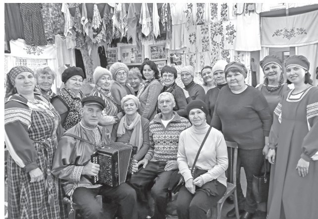
Мироновцы - очень гостеприимные хозяева

Визит в Мироново прошёл на одном дыхании и запомнился всем участникам этой поездки.