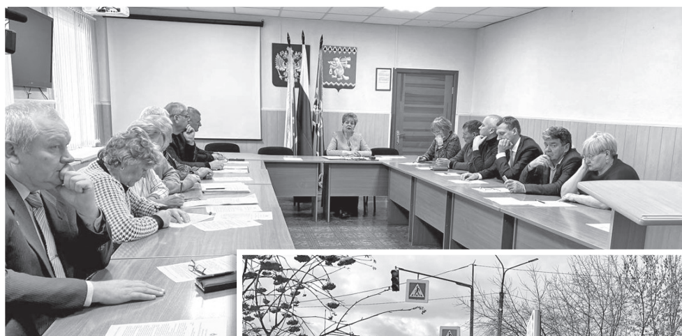
Вопросу оказания качества услуг перевозок общественным транспортом на заседании уделено больше часа