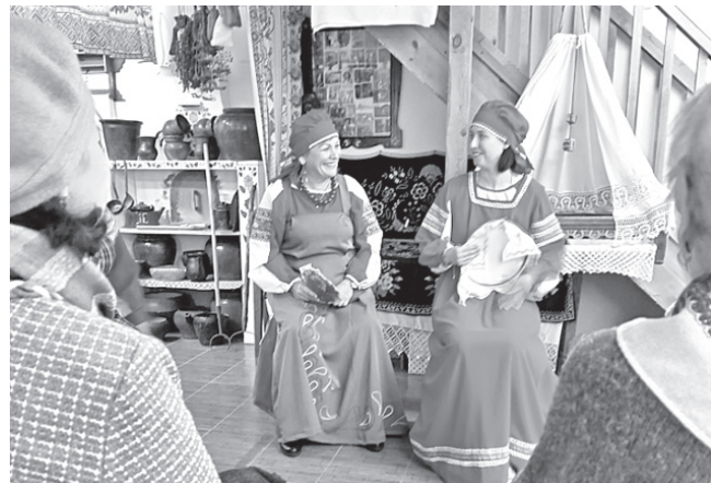
Прикоснуться к народным традициям всегда интересно

Мироновские хозяйки солю под гармошку и дружно встретили гостей хлебом с