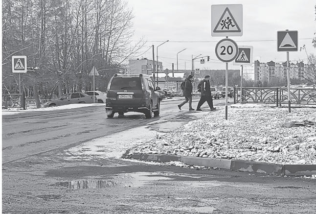
Особо внимательными нужно быть на переходах

Более внимательными в такие дни следует быть и пешеходам: важно помнить, что тормозной путь автомобиля при гололедице значительно увеличивается. Поэтому нужно дожидаться полной остановки транспортного средства перед пешеходным переходом и переходить, контролируя дорожную ситуацию. Не торопитесь, переходя проезжую часть, потому что можно поскользнуться и упасть. Пешеходам нужно использовать световозвращающие элементы, чтобы быть