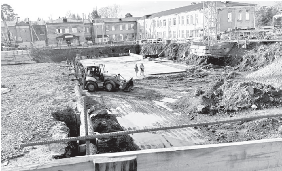
Так выглядит место стройки. Работы идут по графику