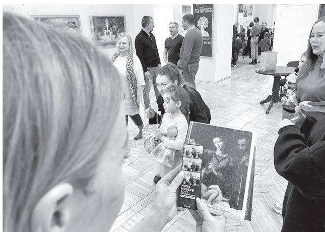
Программа культурного проекта насыщенная и разнообразная

Рассказываем, что интересного ждет 4 ноября жителей Артемовского городского округа