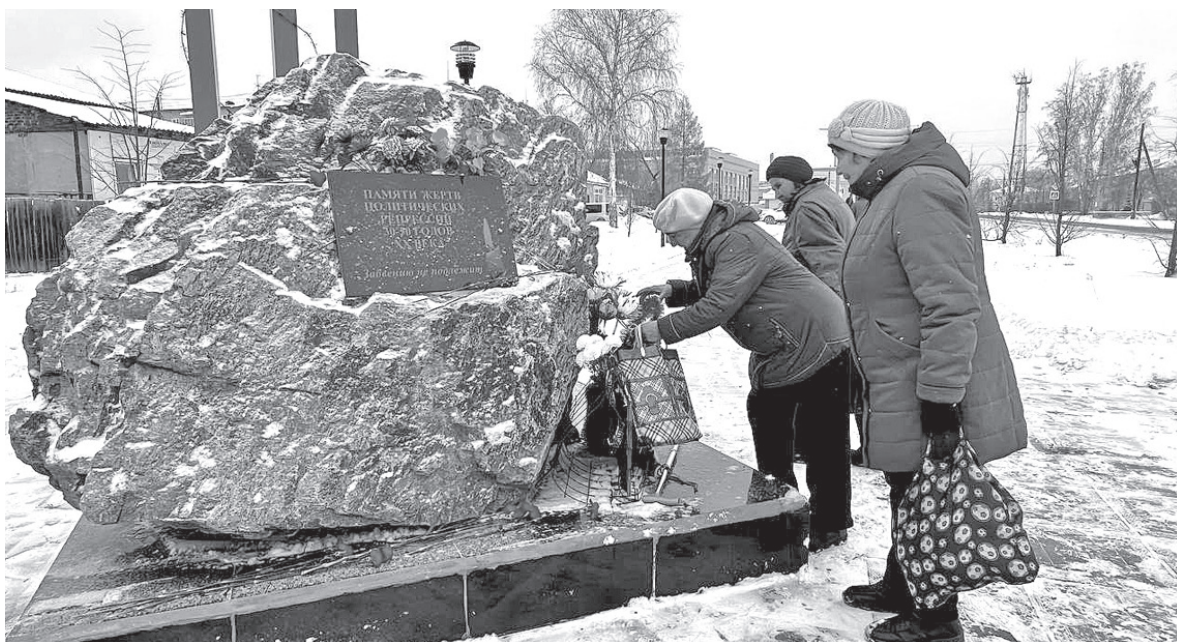
Для родных тех, кто пострадал от политического террора, 30 октября - особый день

30 октября – печальная дата, которая вошла в нашу жизнь как День памяти и скорби жертв политических репрессий. Она посвящена неприглядным событиям, которые невозможно вычеркнуть из истории страны и, без сомнения, важно помнить, чтобы не допустить повторения.