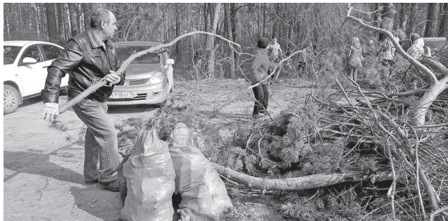
Весенняя уборка преобразит город

В период с 1 по 30 апреля в Свердловской области проходят весенние мероприятия по санитарной очистке территорий населённых пунктов и по приведению их в надлежащее состояние после зимнего периода 2023/2024 гг.