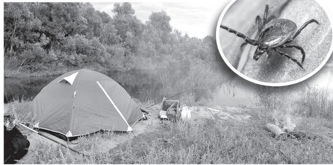
На природе не забываем о кровососах

может заразиться различными инфекциями. Наиболее опасными из них являются клещевой энцефалит, боррелиоз (болезнь Лайма), гранулоцитарный анаплазмоз, моноцитарный эрлихиоз и т.д.